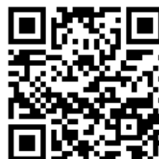
上記のQRコードから 買取査定デモサイトへアクセス