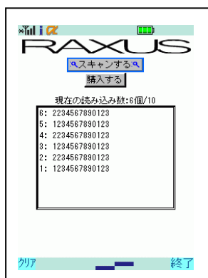
<<バーコード読み取り画面>>

商品を購入する際に、従来の商品名や商品コードで検索する手間を省き、商品やカタログ、スーパーのチラシに印刷されたバーコード（QRコード）を次々とスキャンし、一括購入することが可能です。また、中古買取をしたいゲームや本などの商品バーコードを次々とスキャンし、査定依頼等も一括で行えます。